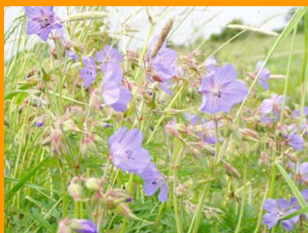
Géranium des prés