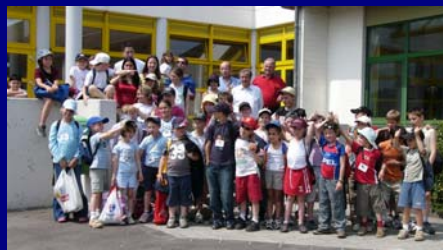
Les « Pappalapiens » lors de leur semaine au Grand-Duché