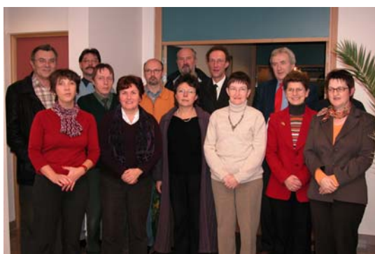
Quelques membres de la Commission de Gestion