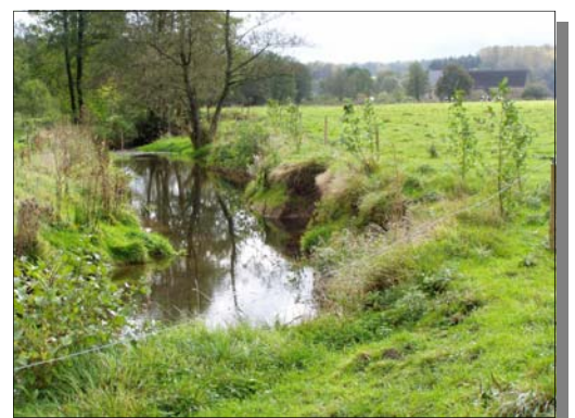
Etat de la berge en septembre 2004