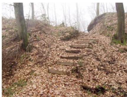
Chemin d'accès au Burgknapp

Les 10 et 11 septembre prochains auront lieu en Wallonie les Journées du Patrimoine. Le thème de cette année est : « Regards sur le Moyen Âge ». C'est donc l'occasion de présenter le site archéologique du « Burgknapp » à Heinstert.