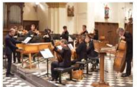
Concert de l'Hostel Dieu