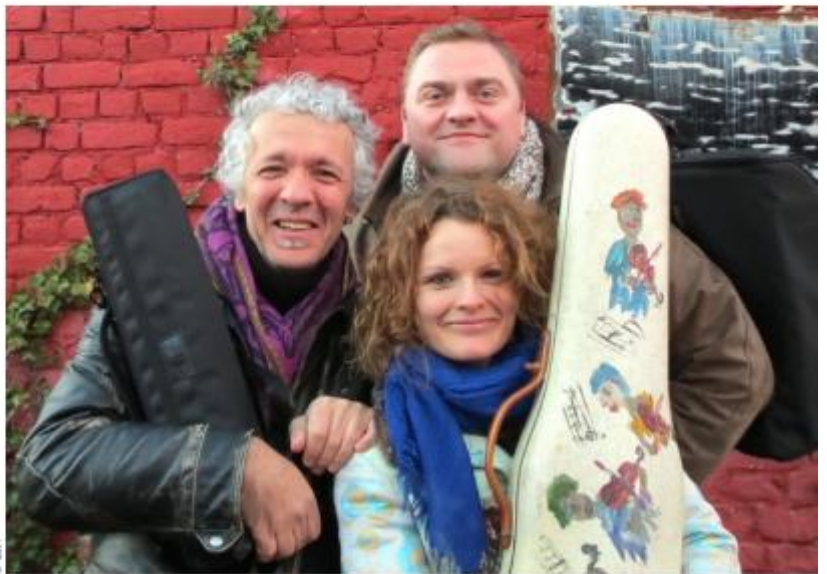
Le trio Astor Klezmer, un des six groupes qui se produiront dans le cadre du festival Musique dans la vallée.

Le samedi 11 septembre à 20 heures , le festival fera étape en l'église d'Attert. « Priez pour paix » est le premier vers d'un poème de Charles d'Orléans et est repris par l'ensemble français De Caelis qui réunit cinq voix féminines. Quand il se transporte dans l'ancienne Perse, il s'associe à la grande voix de Sara Hamidi, une Iranienne exilée. Requiem de Brahms, le dimanche 19 septembre à 16 heures à l'église de Beckerich. Il s'agit de la version avec deux pianos et leurs multiples facettes qui peuvent synthétiser l'esprit de l'orchestre. Elle convient mieux à nos églises.