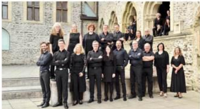
Ensemble vocal du Luxembourg