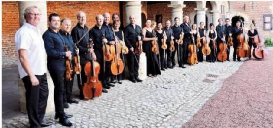
L'Orchestre de la Fondation Arthur Grumiaux