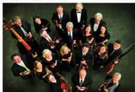
L'Orchestre L'Arpa Festante