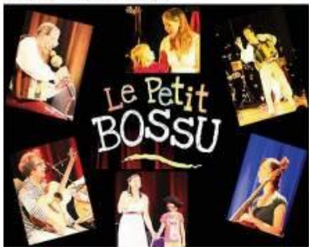
Spectacle Le Petit Bossu