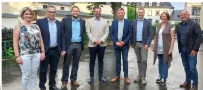
Les organisateurs de ce festival viennent de part et d'autre de la frontière belgo-luxembourgeoise.

Un tout autre programme nous attend en l'église de Redange le samedi 13 septembre à 20h . L'ensemble Ailack composé de deux ténors, d'un baryton et d'une basse nous entrainera dans les vallées et les monts de l'Europe orientale, de la Bulgarie