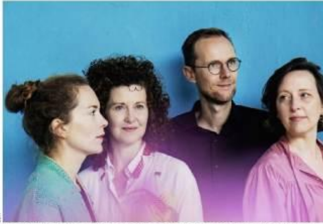
L'ensemble Revue blanche proposera un concert autour des œuvres de Maurice Ravel à Tontelange.

Après un morceau plus contemporain avec Da Pacem domine écrit par Arvo Pärt, l'organiste Marc Steffens mettra les orgues de l'église de Ell en valeur. Ensuite une partie importante sera